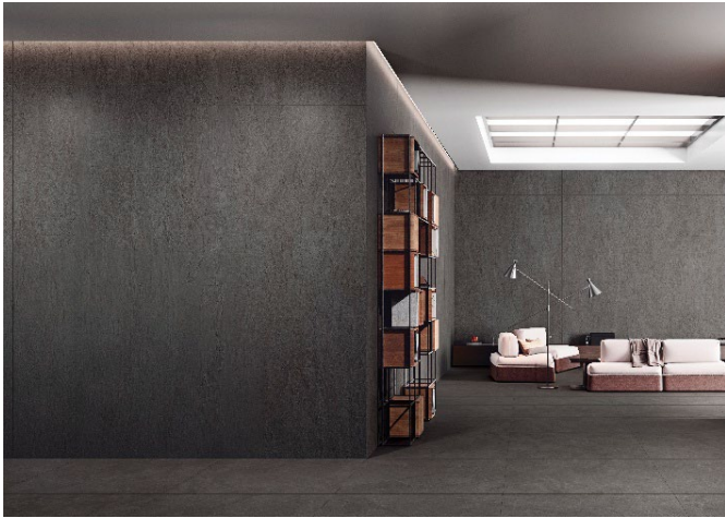
《バサルティ》施工イメージ

住宅設備機器のインターネット販売を行う株式会社ミラタップ（所在地：大阪市）は、2026年5月8日（金）より、スラブタイル（超大判タイル）の販売を開始します。第1弾の一部商品には、フルセラミックキッチン《ジオーラ》と同一素材のスラブタイルを採用しており、より統一された空間デザインを実現します。また、6月以降も順次、新たなスラブタイルのラインアップを追加します。