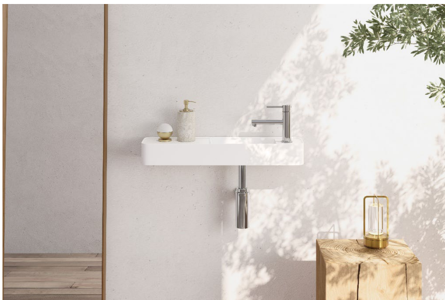
《ルメロ》施工イメージ

住宅設備機器のインターネット販売を行う株式会社ミラタップ（所在地：大阪市）は、奥行き 15cm のコンパクト設計で、玄関や廊下などの限られたスペースにも設置できる手洗器《ルメロ》を、2026年5月7日（木）に発売します。狭小住宅の増加を背景に、“ミニмумラグジュアリー”をコンセプトにセカンド洗面としての需要に対応した新商品です。