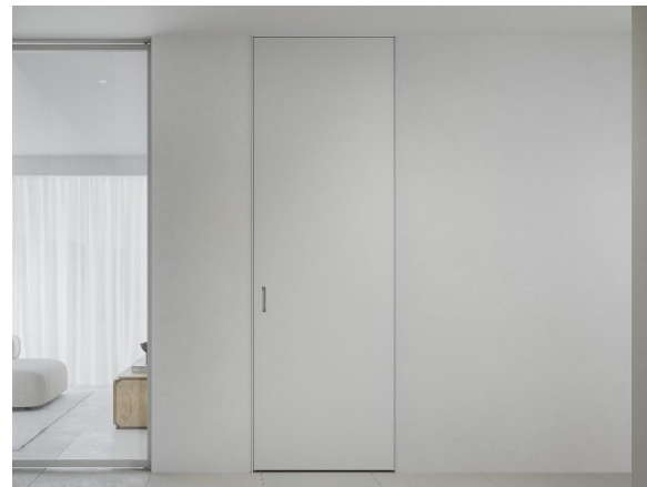
《リミナル》施工イメージ

近年、SNS の普及により、住宅の完成事例や空間表現を目にする機会が増えています。それに伴い、住宅検討者や建築士の間では、単なる間取りや設備だけでなく、細部の納まりにまで目が向けられるようになりました。こうした背景から、できるだけ無駄をそぎ落とし、空間そのものを美しく見せるノイズレスなデザインが注目されています。