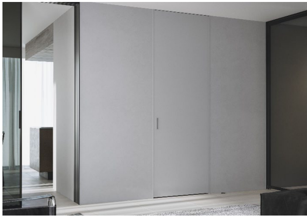
《リミナル》施工イメージ

住宅設備機器のインターネット販売を行う株式会社ミラタップ（所在地：大阪市）は、金物や段差などの視覚的な要素を極力排除し、空間に自然に溶け込む“ノイズレス”デザインを追求した室内ドア《リミナル》を、2026年5月7日（木）に発売します。隠し丁番や埋め込み式取手を採用し、見付け幅 5.5mm の極細設計により、壁面と一体化するような納まりを実現しました。