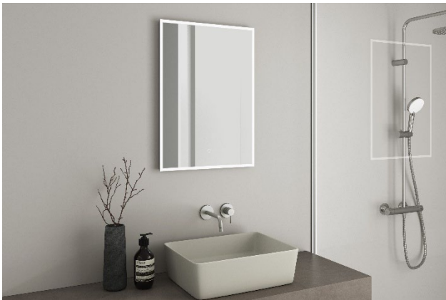
《ロイナ》施工イメージ

住宅設備機器のインターネット販売を行う株式会社ミラタップ（所在地：大阪市）は、顔を明るく照らす LED 照明と収納機能を一体化したミラーキャビネット 《ロイナ》を 2026 年 5 月 7 日（木）に発売します。