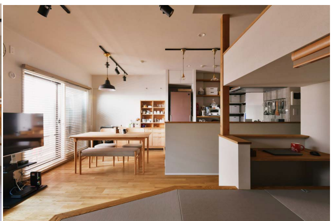
1 位 スタイル工房