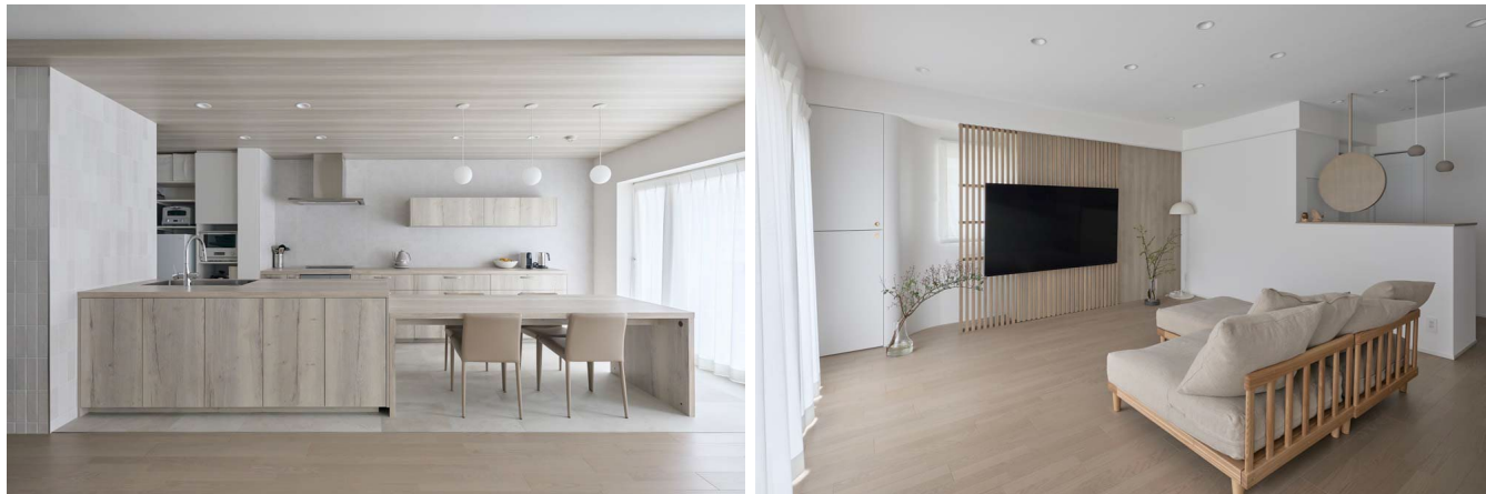
2 位リノベーションスタジオ KULABO

キッチン横と正面の 2 方向に窓がある角部屋という好条件を活かし、日当たりや風通しはそのままに、より快適な空間へリノベーションした物件。窓の前にルーバーを取り付け、壁掛けテレビを配置することで採光を確保。さらに、ルーバーの裏にはあえてデッドスペースを作り、実用的な収納場所を設けています。ルーバーにより視線が抜けて奥行き感が生まれ、LDK 全体に開放感をもたらしています。