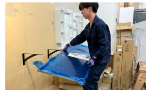
1人で取り付けを行う様子

天板の重量は幅900mmタイプで約9kgと軽量なので、1名でも簡単に取 り付けが可能です。