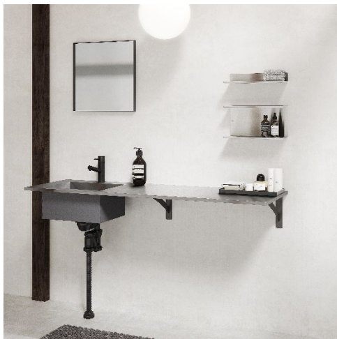
洗面台としての使用イメージ

住宅設備機器のインターネット販売を行う株式会社ミラタップ（所在地：大阪市）は、ステンレス製のカウンターシンク《インダスターカウンター》を4月1日に発売しました。洗面台やコンパクトキッチンとして、多様な用途で使用できる壁付け型のシンクです。様々なインテリアに溶け込むミニマルなデザインと、施工しやすい設計を両立しました。