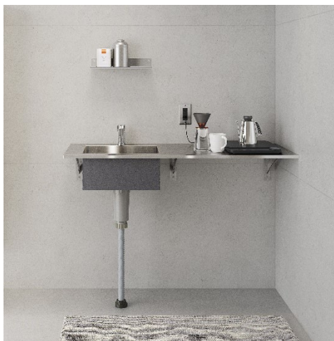
ミニキッチンとしての使用イメージ