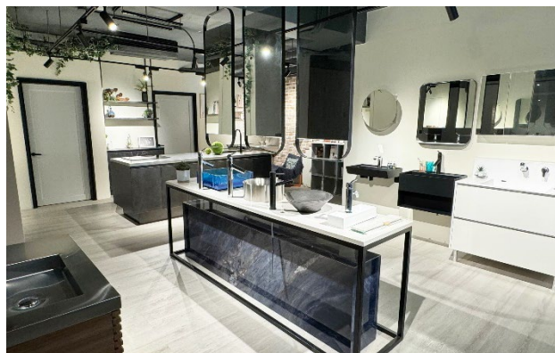
台湾ショールーム内観写真