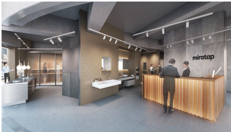
京都ショールーム内観イメージ

住宅設備機器と建築資材のインターネット通信販売を行うサンワカンパニー（所在地：大阪市）は、2024年9月24日（火）、京都市中京区にショールームを新規オープンいたします。当社としては全国8店舗目のショールームであり、関西エリアでは大阪に次ぐ2店舗目の出店となります。京都ショールームは法人顧客をメインのターゲットに設定し、展示商品を選定しております。今回の出店を通して、京都エリアでの企業認知向上及び更なる売上の拡大を目指してまいります。