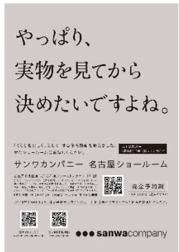
名古屋駅にて掲出する広告イメージ（全長約8m）