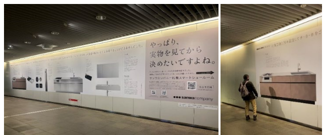
札幌駅前通地下広場に掲出した実際の広告

今回の広告では、当社で売上上位のシステムキッチンや洗面台を実寸大でご覧いただくことができます。当社の認知度向上やショールーム来場を促進し、より多くのお客様の「くらしを楽しく、美しく。」を実現していきたいと考えています。