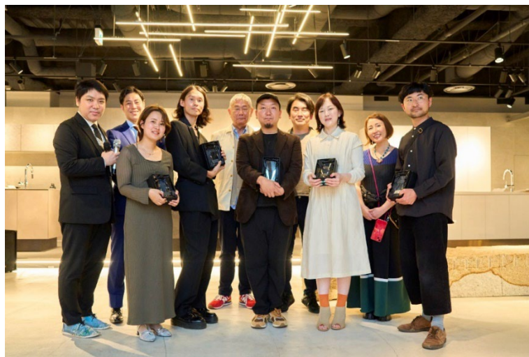
sanwacompany Art Award / Art in the House 2024 授賞式の様子