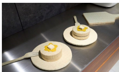
「Tatami cake」「Tatami cutting board」