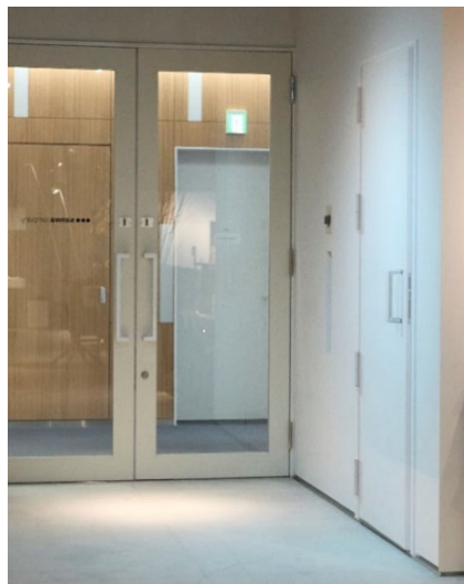
※右手前のドアが作品

サンワカンパニーさんのHPの中に「感性を刺激し続ける空間を提供すること」という言葉を見つけました。この言葉は、私自身、空間を扱うインスaller作家として、強く共感するところです。尚且つサンワカンパニーさんの取り扱う製品は、常に身近にある生活環境（空間）にも向けられたものだとも思います。今回どのような空間にも存在する、「扉と窓」をモチーフとして、人の意識によって見え方が変わる作品を展示することで、アートが生活の延長にあるものとしても、捉えていただけるのではないかと考えています。