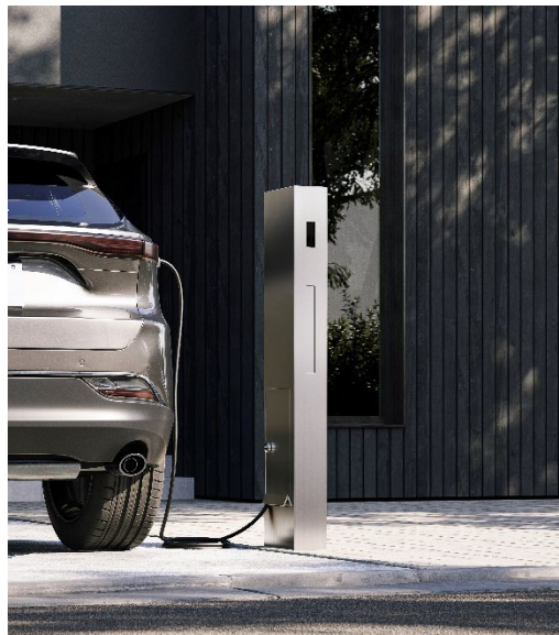
《オスポールEV》設置イメージ