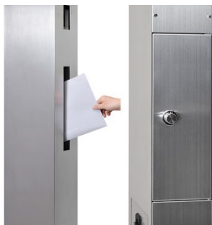
《オスポールEV》の郵便ポスト

前入れ後出しの縦型ポスト付きです。背面にはダイヤル錠が付いており、A4サイズも楽に取り出せます。