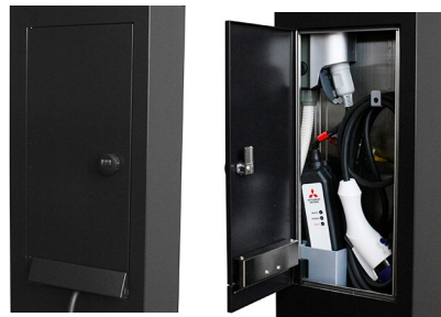
《オスポールEV》のEV充電ボックス (充電ケーブルは付属しません)

充電ケーブルの取り出し口にはフラップドアを採用し、ケーブルを出したまま扉を閉められるようにしました。また、キャビネット内のフックにケーブルを巻き付ければ納まりが良く、引き出す際もスムーズです。