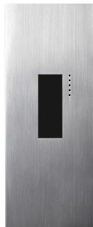
《オスポールEV》のインターホンパネル