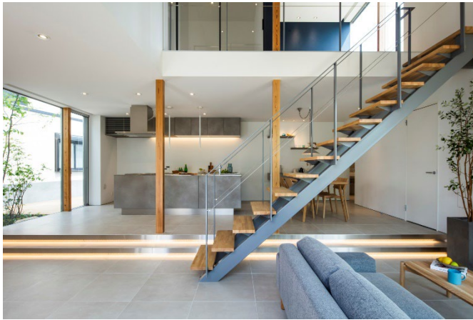
《ASOLIE》フラッグシップハウスの内観

サンワカンパニーは住宅設備機器・建築資材の企画開発、輸入、販売を行っております。「くらしを楽しく、美しく。」を経営理念として掲げ、ミニマリズムをコンセプトとしたデザイン性の高い商品をインターネットで、ワンプライスカつ普及価格帯で販売。お客様への直接販売という、業界の常識を覆すビジネスモデルを構築してきました。2020年にはスペースデザイン事業部を立ち上げ、デザイン性の高い住宅を提供する戸建て事業《ASOLIE（アソリエ）》を展開しています。