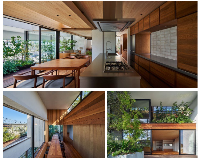
↑ 2022年施工事例部門 最優秀賞作品 『HOUSE F-つながりを生む場所-』 by 株式会社かまくらスタジオ 福井啓介・森川啓介