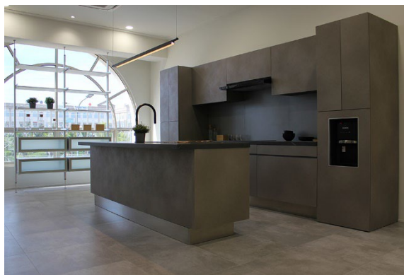
ショールーム内観