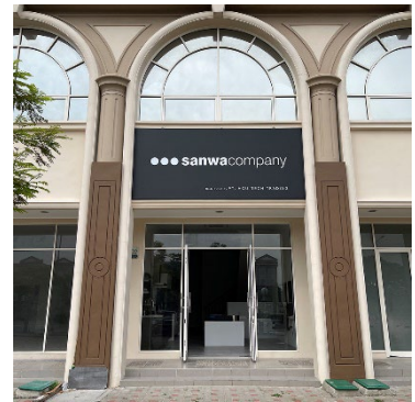
ショールーム外観

商 品 展 示 数 : 21点 (グラッド45ブラック、プレーン Kプティ、フッカ、Cスルー、ノッポ、 ピッタラ 他)