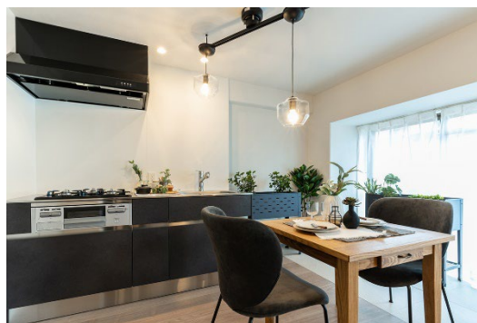
キッチン：《ウィッテ》※特注色