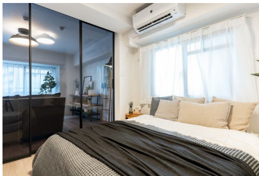
ガラスドア：《クアドロスリム》

● 《sanwacompany renovations》の詳細や物件の内覧ご予約は、下記HPをご覧ください。