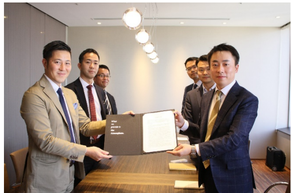
<サンワカンパニーと寧波三羽商貿有限公司との調印式の様子>

今後、新会社にて上海・武漢・寧波に順次ショールームを開設するとともに、中国の越境EC最大手である「天猫 (Tmall)」での販売も予定しています。