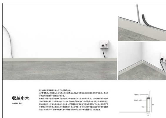
↑2019年プロダクトデザイン部門 最優秀賞受賞「収納巾木」（浅野 皓貴）

本アワードの開催は今年で5回目となります。2018年の開催から、若手の建築家やデザイナーの挑戦をより後押しするべく新人賞の枠を設けております。過去のプロダクトデザイン部門では学生や海外からの受賞者が出るなど、幅広い才能の発掘、支援に繋がっております。